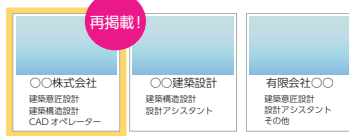
「採用ご担当者様マイページ」